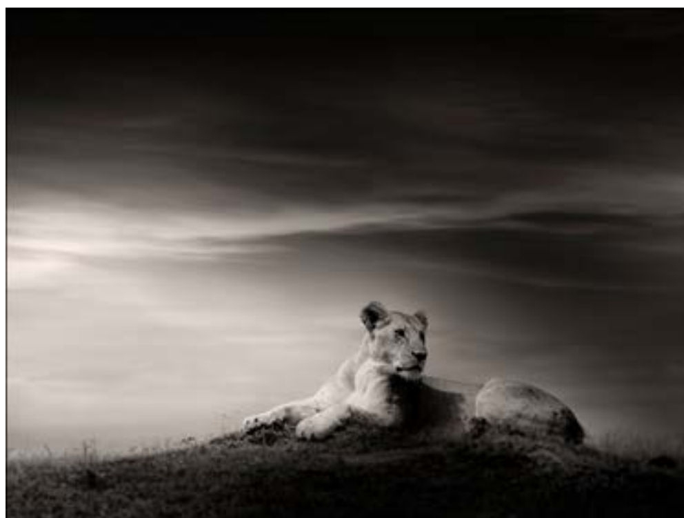
Credits: © Joachim Schmeisser, The Lioness, 2020 by Courtesy of Echo Fine Arts