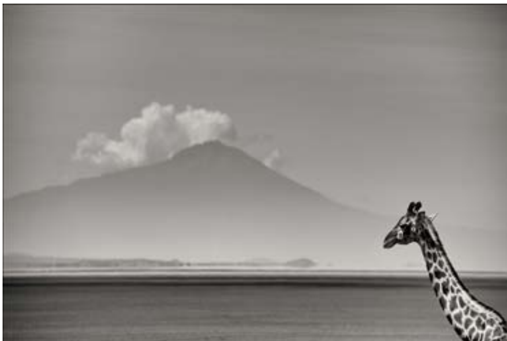
Credits: © Joachim Schmeisser, Giraffe in Front of Mount Kenya, 2019 by Courtesy of Echo Fine Arts