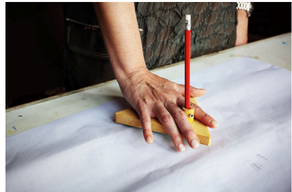
4. Automatic writing experiment using a planchette, Arthur Findlay College, UK, 2012