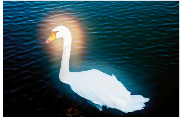
2. Swan on Lake Cassadaga. Lily Dale, NY, USA, 2010