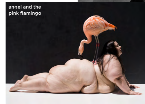
angel and the pink flamingo

„Голото тяло е безкрайно вълнуващо, то е вечно с всичките свои изразителни детайли, текстури и форми, които подбуждат въображението ми“, споделя Силви Блум.